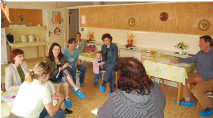
Stretnutie rodičov detí s poslancami miestneho zastupiteľstva